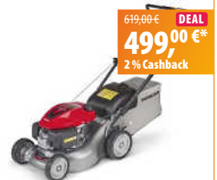
Honda Benzin-Rasenmäher HRG 416C1 SK