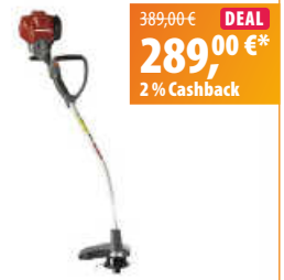
Honda Benzin-Rasentrimmer UMS 425