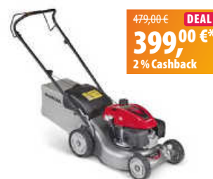
Honda Benzin-Rasenmäher HRG 416C1 PK