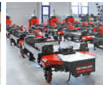
Maschinen- und Fahrzeugbau