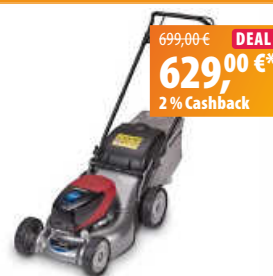
Honda Akku-Rasenmäher HRG 416 XB PE

Im breiten Sortiment findest du namhafte Marken wie Stihl, EGO, Kärcher und die Hausmarke Greenbase Kölle. Für alle, die sich nicht dauerhaft binden wollen, bietet der Fachmann Mietgeräte von der Heckenschere über Hochdruckreiniger bis hin zum Minibagger an.