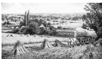
Gemälde Getreideernte

Herzlichen Dank für die Mitarbeit. Wir in Biederbach.