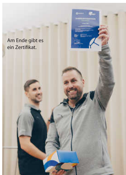
Am Ende gibt es ein Zertifikat.