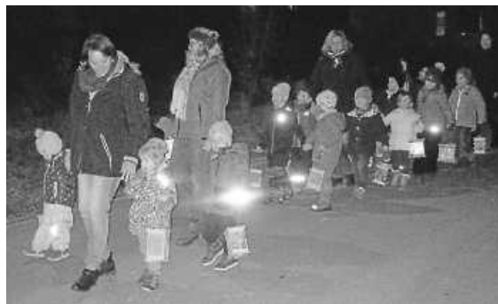
Die Kindergartenkinder beim Umzug