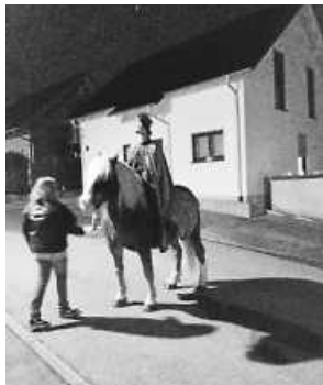
Der Martinsreiter führte den Umzug an

Den Bewohnern von Biederbach, die die Straßen vor ihren Häusern wieder mit bunten Lichtern geschmückt haben