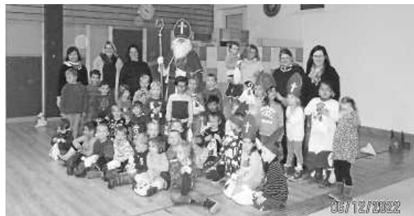
Die Kinder und ErzieherInnen mit dem Nikolaus

Dem Elternbeirat für die hilfreiche Unterstützung.