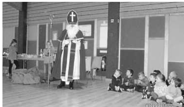
Besuch vom Nikolaus