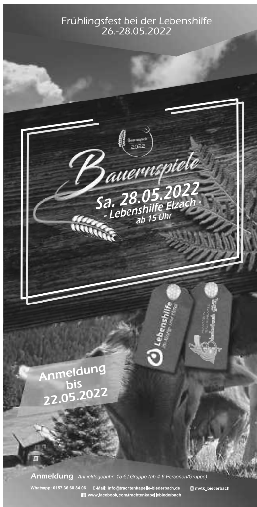
Bauernspiele am 28.05.2022 ab 15 Uhr