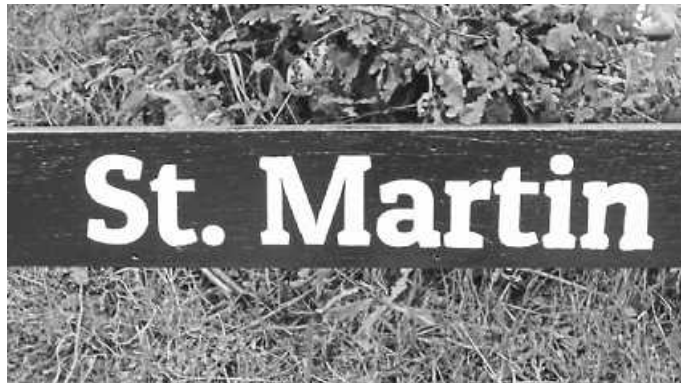
Kapelle St. Martin

Herzlich willkommen zum Innehalten, Ruhe finden, Zeit für persönliche Gebete.