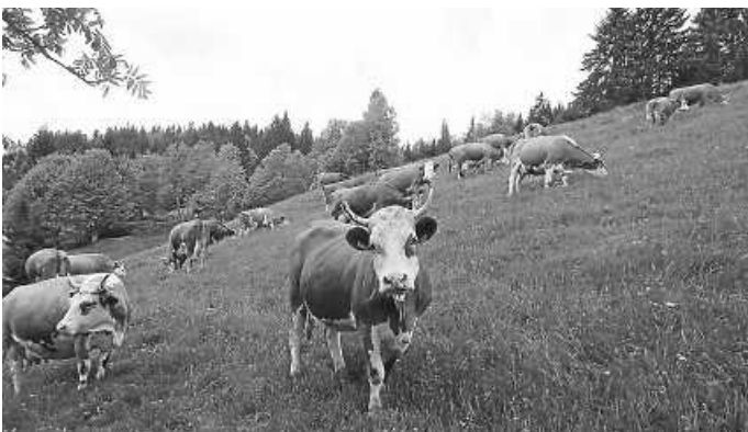
Weidfeld bei Äule; JM Henry: Lebensraum für vielerlei Arten bieten Weideflächen wie diese bei Schluchsee-Äule

Weitere Informationen finden sich unter: www.naturpark-wiesenmeisterschaft.de .