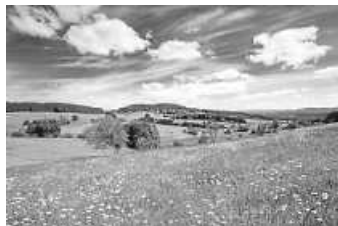
Frühlingsstimmung im ZweiTälerLand

Um den wichtigen Wirtschaftsfaktor Tourismus im ZweiTälerLand (ZTL) zu stärken und marktorientiert in die Zukunft zu führen, setzt die ZTL-Tourismusgesellschaft die Erstellung ihrer Tourismusstrategie 2030 fort. Im Rahmen mehrerer Workshops sind alle Interessierten eingeladen, Ihre Ideen, wie der Tourismus im ZweiTälerLand zukünftig