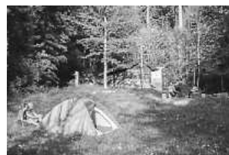
Beim Trekking im Schwarzwald dürfen naturverbundene Wanderer ganz legal mitten im Wald ihr Zelt aufschlagen

Sternenhimmel, frische Luft und Lagerfeuerflair – wer die schlichte Schönheit des Natürlichen liebt, sollte sich gleich einen Platz in einem der Trekkingcamps im Schwarzwald sichern. Am 15. März um 6 Uhr wurde das Buchungsportal für Wandernde, die naturverträglich draußen übernachten wollen, wieder freigeschaltet. Die Trekking-Camps, die alle außerorts an Fernwanderwegen liegen, können im