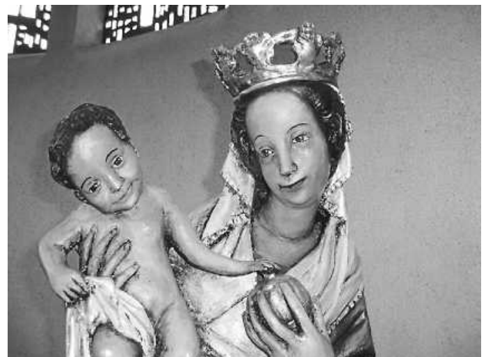
Mutter Gottes mit Jesus-Kind in der Kapelle „St. Martin“

Herzlich willkommen zum Innehalten, Ruhe finden, Zeit für persönliche Gebete.